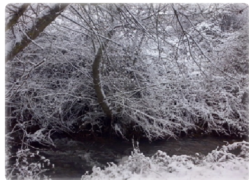
GRUPO DE MEDIOAMBIENTE

Seguimos creyendo en la importancia intrínseca de la Naturaleza y también en que es un magnífico ámbito para desarrollar las capacidades que todas y cada una de las personas llevamos en nuestro interior.