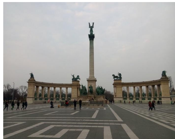
Plaza de los héroes