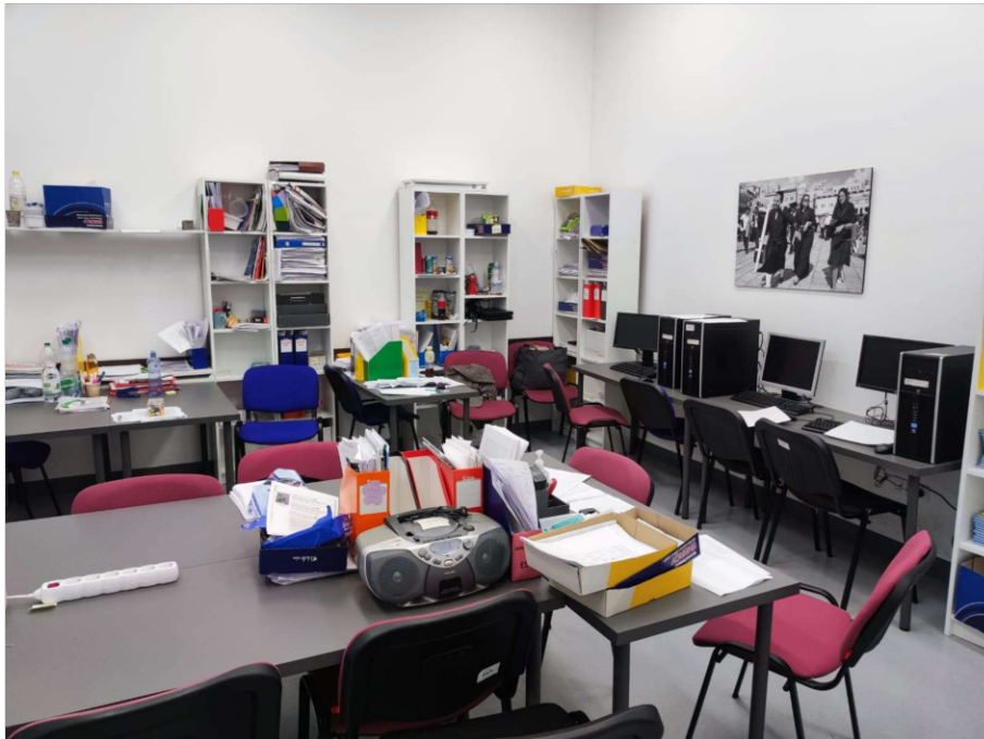
Sala de profesores