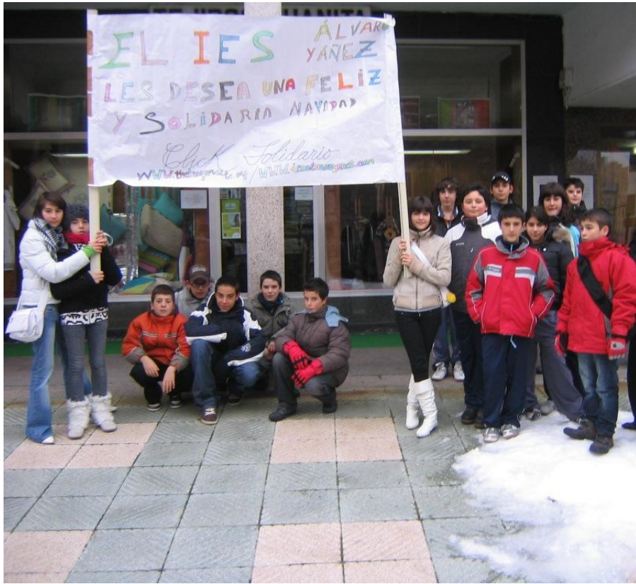
ACTIVIDAD DE CALLE CON INFORMACIÓN DEL CLIC SOLIDARIO