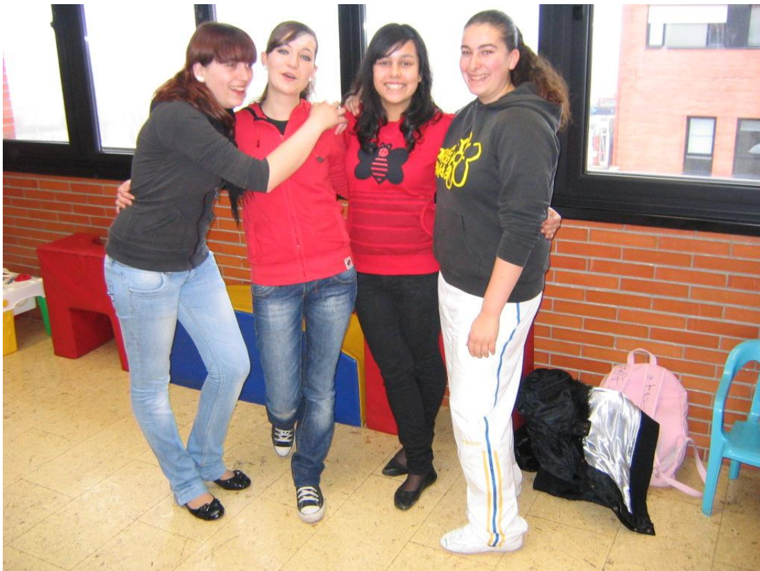
VISITA A LA SECCIÓN DE PEDIATRÍA DEL HOSPITAL DEL BIERZO EN PONFERRADA