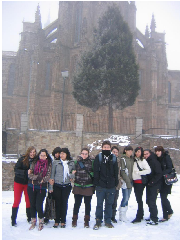
VISITA A ASTORGA PARA COMPARTIR UNA MAÑANA CON LOS ALUMN@S DEL CENTRO DE EDUCACIÓN ESPECIAL COSAMA/