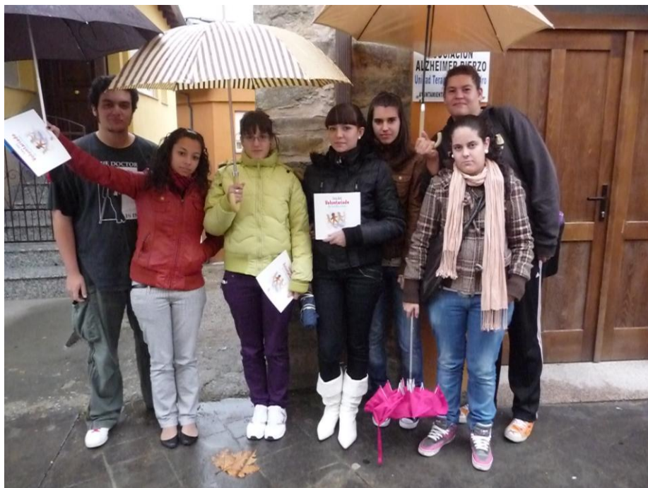
VISITA AL CENTRO DE LA ASOCIACIÓN ALZHEIMER BIERZO EN BEMBIBRE