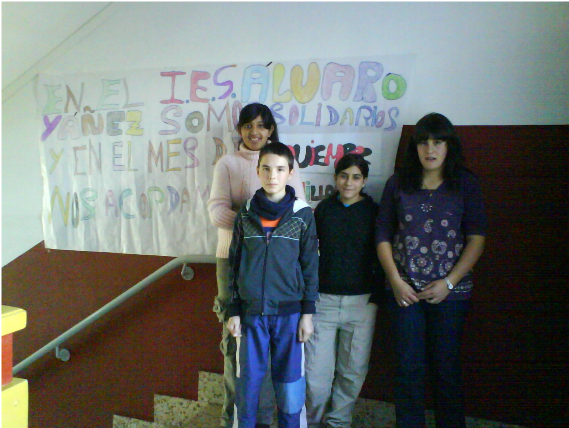
INFORMACIÓN EN EL CENTRO DE TIPO SOLIDARIO