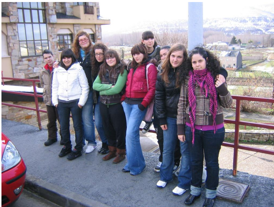
VISITA A LA RESIDENCIA DE ANCIANOS DE BEMBIBRE