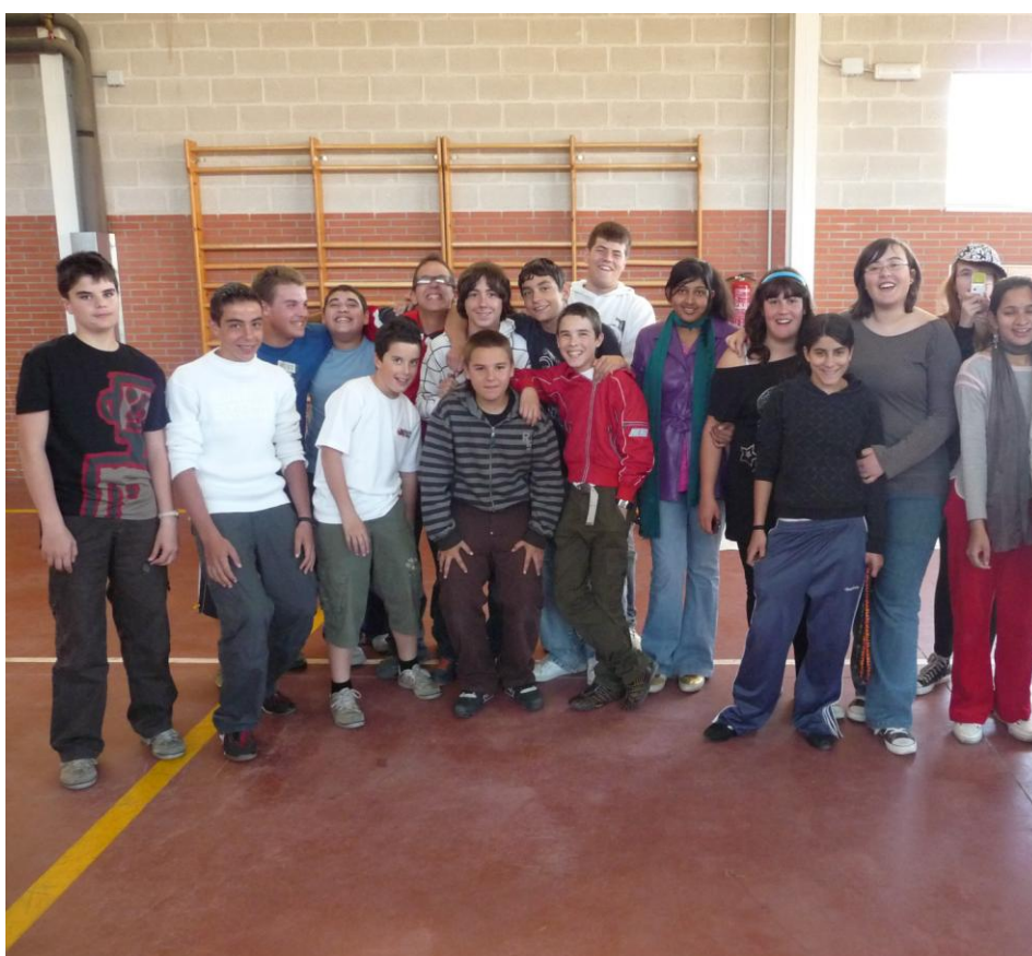
LA REUNIÓN DE LOS PEQUEÑOS UN JUEVES CUALQUIERA