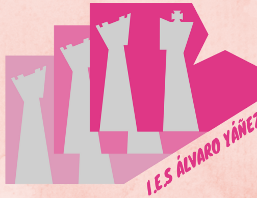
I.E.S. ÁLVARO YÁÑEZ

LUGARES EMBLEMÁTICOS DE LA NOVELA LANDMARKS OF THE NOVEL