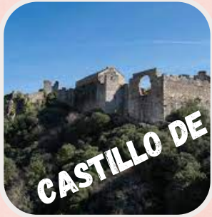
CASTILLO DE CORNATEL

El castillo de se encuentra ubicado en el municipio de Priaranza del Bierzo.