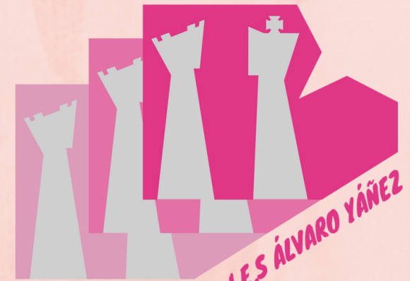
I.E.S. ÁLVARO YÁÑEZ