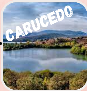
LAGO DE CARUCEDO

The castle sits on a rocky promontory cut to the east and north by a ravine, with a drop of more than 180m. On its other two flanks, which are easily accessible, it is protected by a single wall with a crenellated defensive walkway.